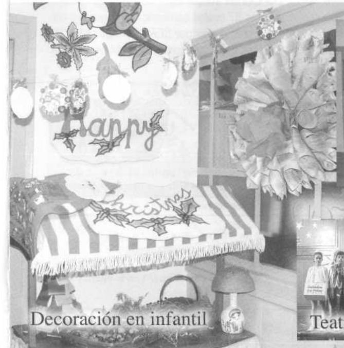
Decoración en infantil