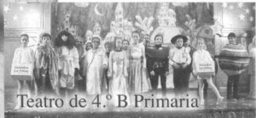
Teatro de 4.º B Primaria