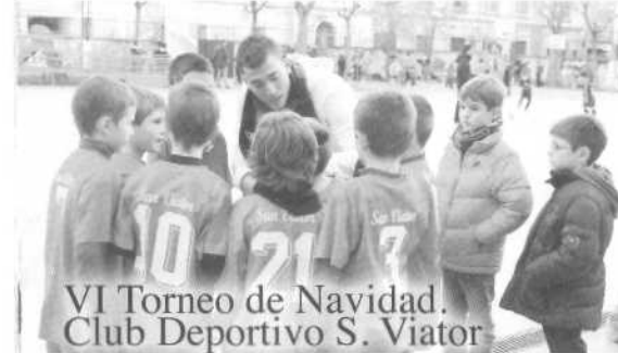
VI Torneo de Navidad. Club Deportivo S. Viator