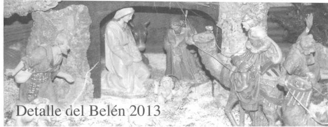
Detalle del Belén 2013