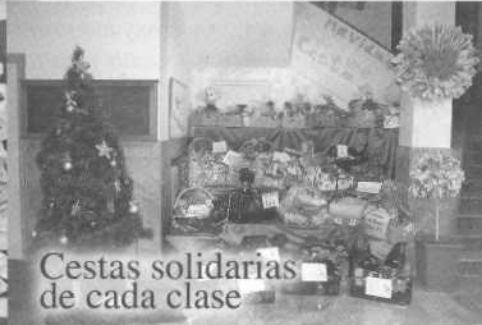
Cestas solidarias de cada clase